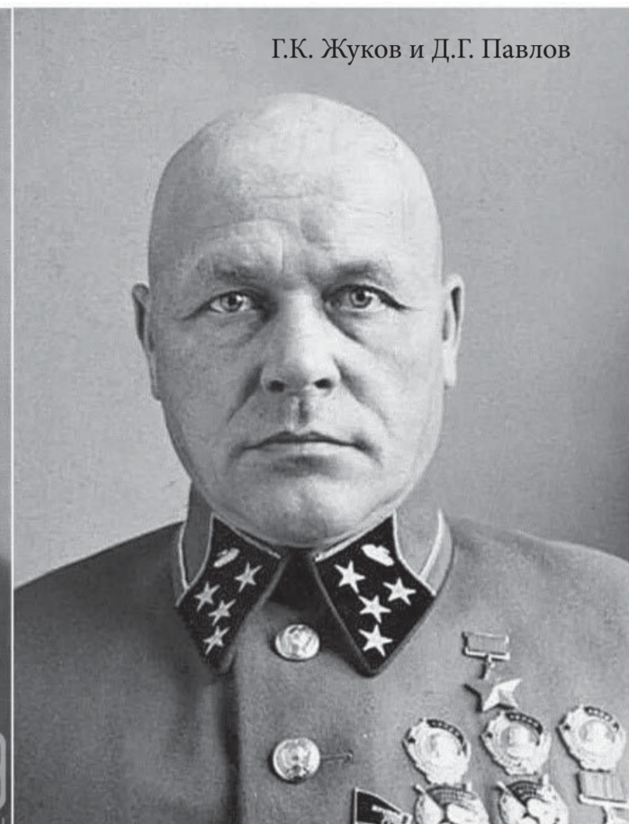
Г.К. Жуков и Д.Г. Павлов