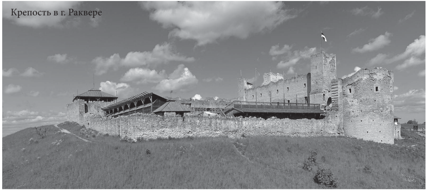
Крепость в г. Раковере

ний, не подтверждается ни русскими, ни иностранными свидетельствами современников. В своих публичных выступлениях на лекциях, в начале 80-х гг. прошлого века, он утверждал, что эта теория была создана как «социальный заказ», лишь в XVIII в., иностранцами, для утверждения идеологии РАБСКОГО ПРОИСХОЖДЕНИЯ РУССКИХ.